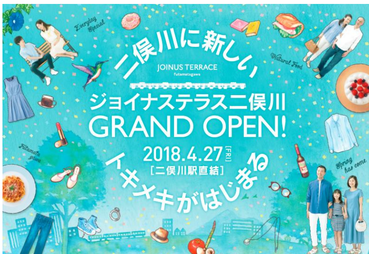
「ジョイナス テラス二俣川」 グランドオープンイメージビジュアル