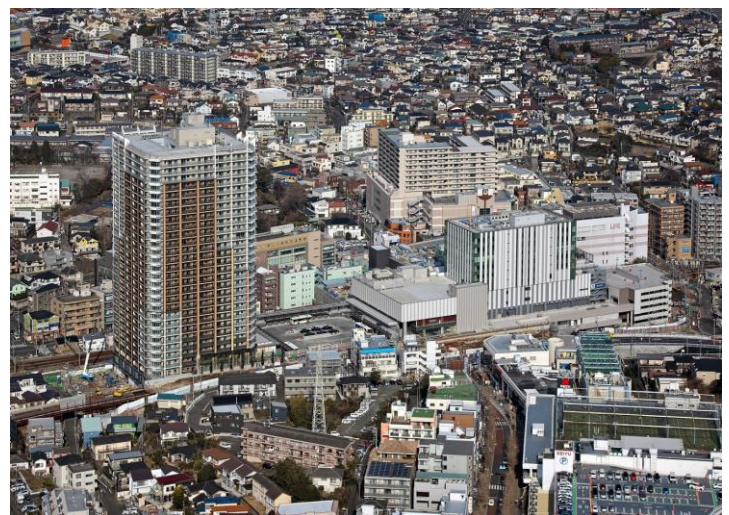
「ジョイナス テラス二俣川」 および相鉄線二俣川駅周辺の様子（2018年1月撮影）