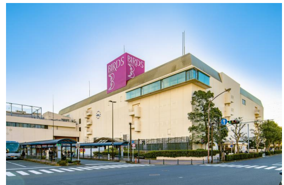
港南台バーズ 外観

※地下1階の「無印良品 食料品フロア」のみ、5月14日（金）オープン予定となります。また、飲食店など一部営業時間が異なる場合があります。